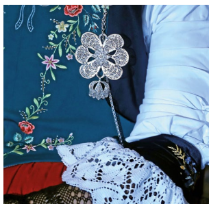
Trachtenausstellung Trachtenhandwerk auf dem Lindenhof