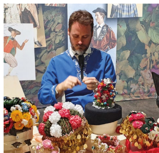
Kantonsdörfli in der Stadthausanlage beim Bürkliplatz